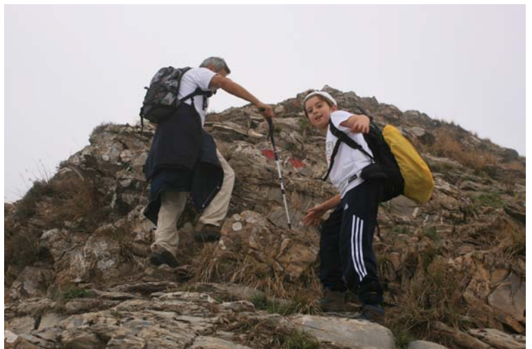
Dai, che si tocca il cielo!