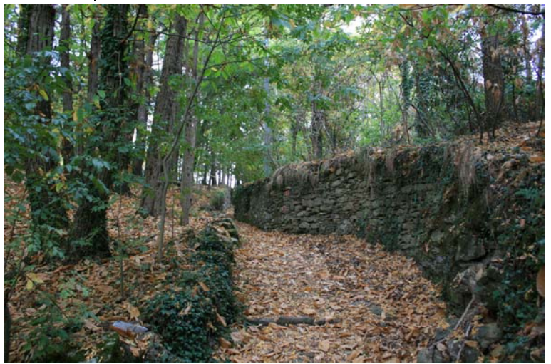
Si sale con due rombi rossi, all'inizio anche con un cerchio barrato