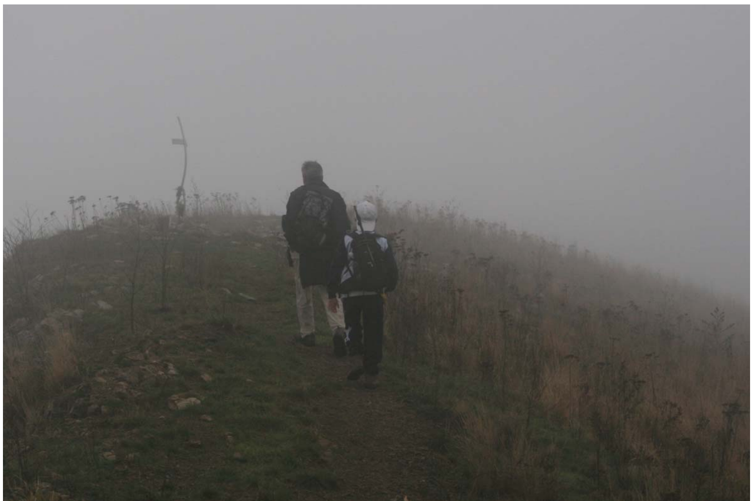
Croce di vetta nella nebbia, poi si continua su un sentierino senza segnavia (prudenza), prima evidente poi entra nel bosco e bisogna essere attenti...