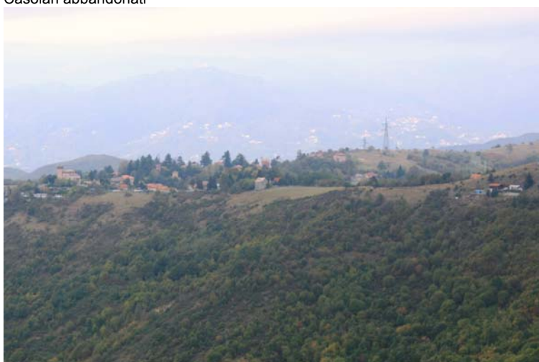
Creto, dal sentiero di salita