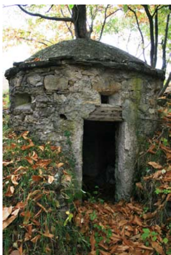
Costruzione lungo la ripida (!) salita