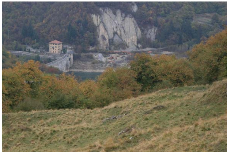
Scorcio sul lago Val Noci, mezzo vuoto