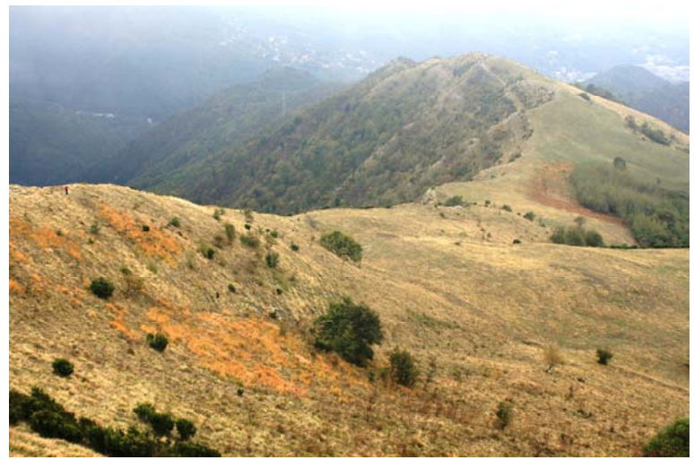
ma dopo riprende...