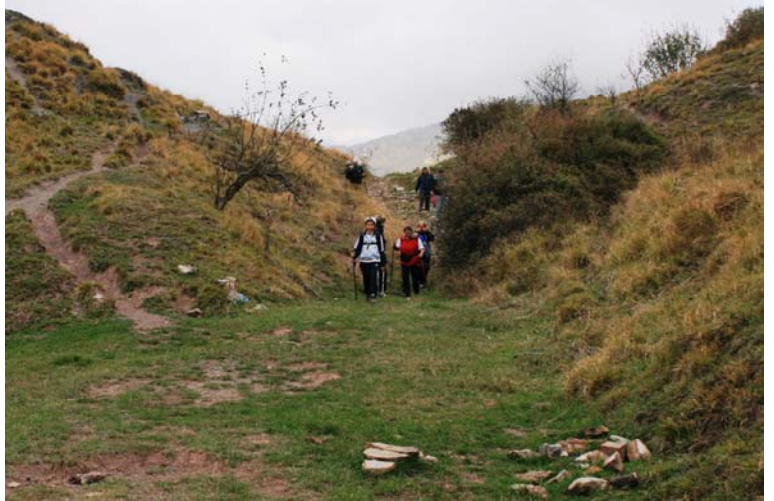
Gola di Sisa 730 m. pausa pranzo