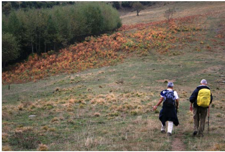
Finalmente spiana un po'... presso il monte Pian di Croce (776 m)