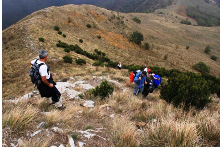
Sempre più ripido