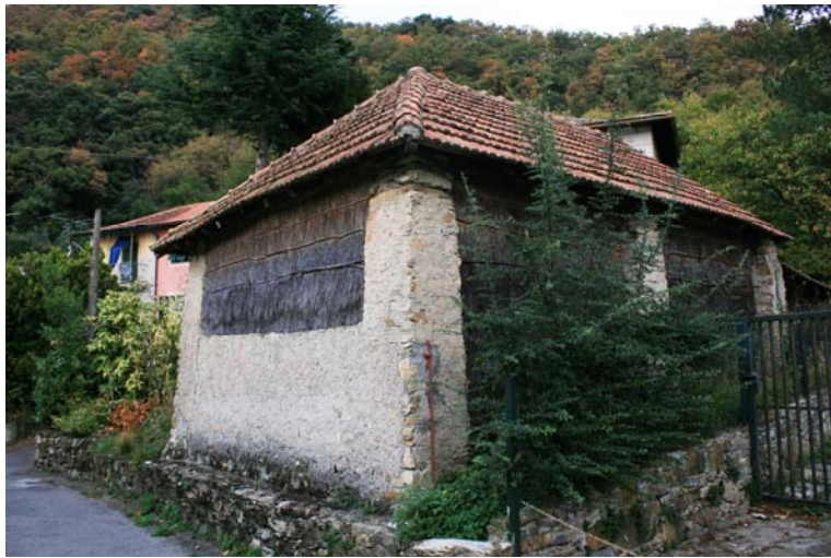
Ultime case a San Martino di Struppa a 357 m