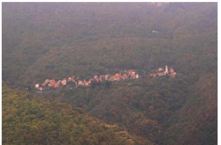
Marsiglia, caratteristico paesino dell'entroterra