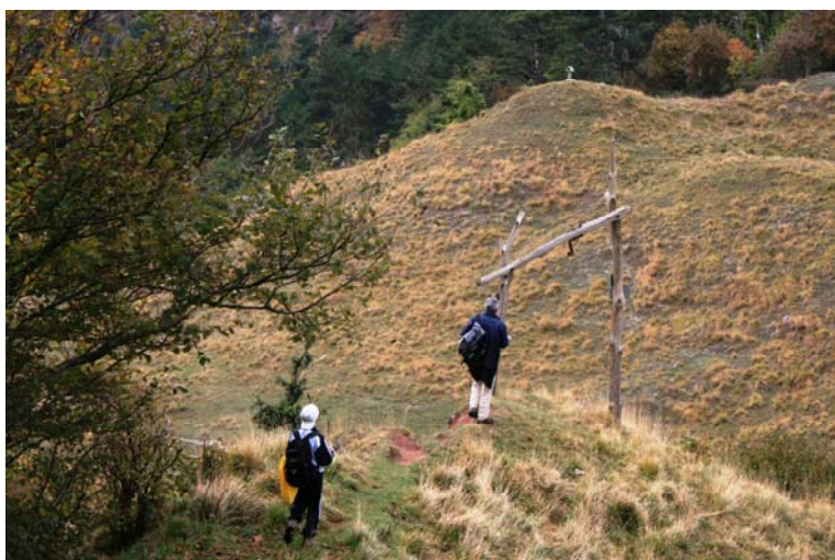
Dopo aver perso circa 200 m di quota si trova l'AV e si piega a sinistra