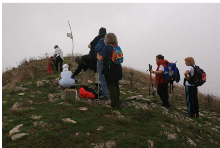
Cima Aplelisa a 983 m