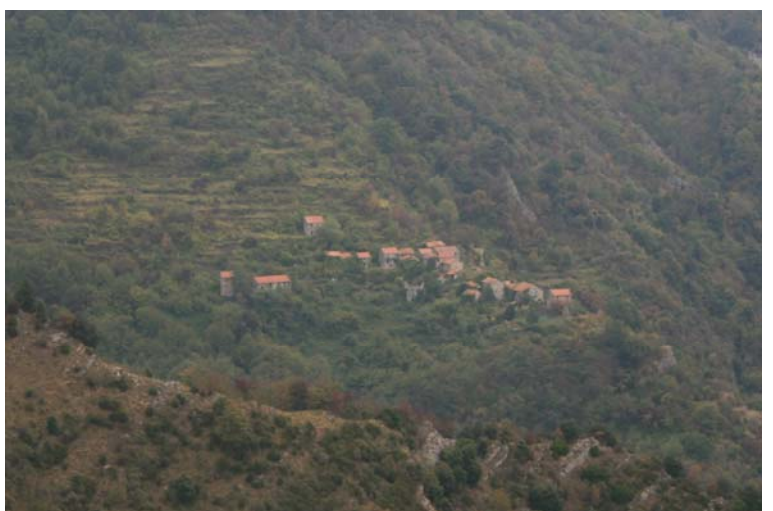
Il borgo abbandonato di Canate