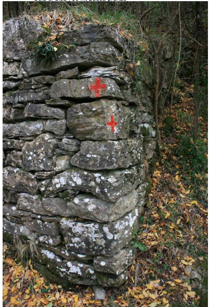
Segnavia del ritorno, splendido anello (quasi 2h30 salita, 45' per Gola di Sisa, 1h15m per S. Martino)