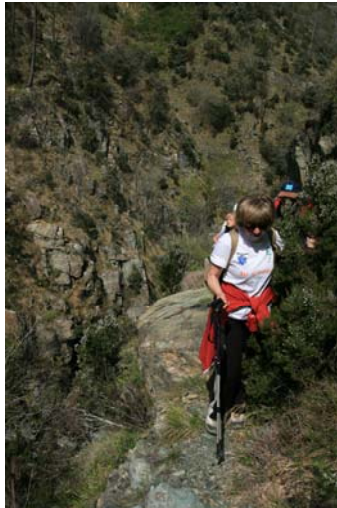
passaggio difficile dopo i 2 guadi