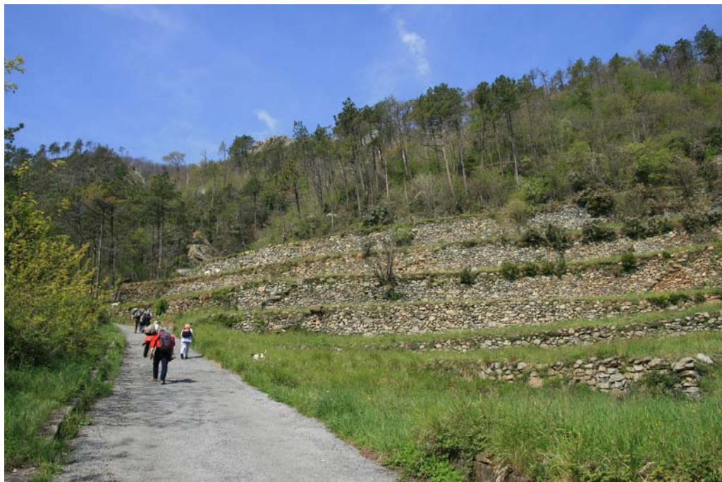
Salendo verso Case Stellin