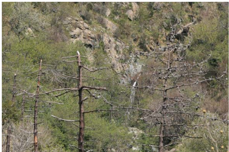
Il bel salto del rio Malanotte, visto in lontananza