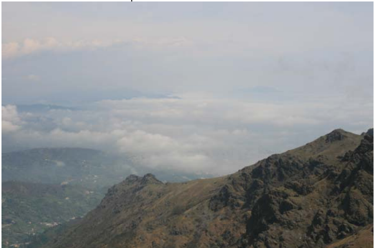
Nuvole verso la città