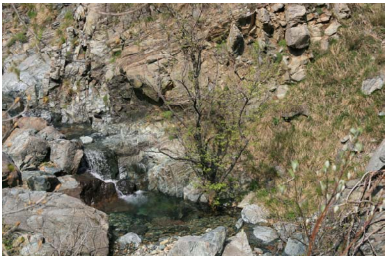
Rio della Gava