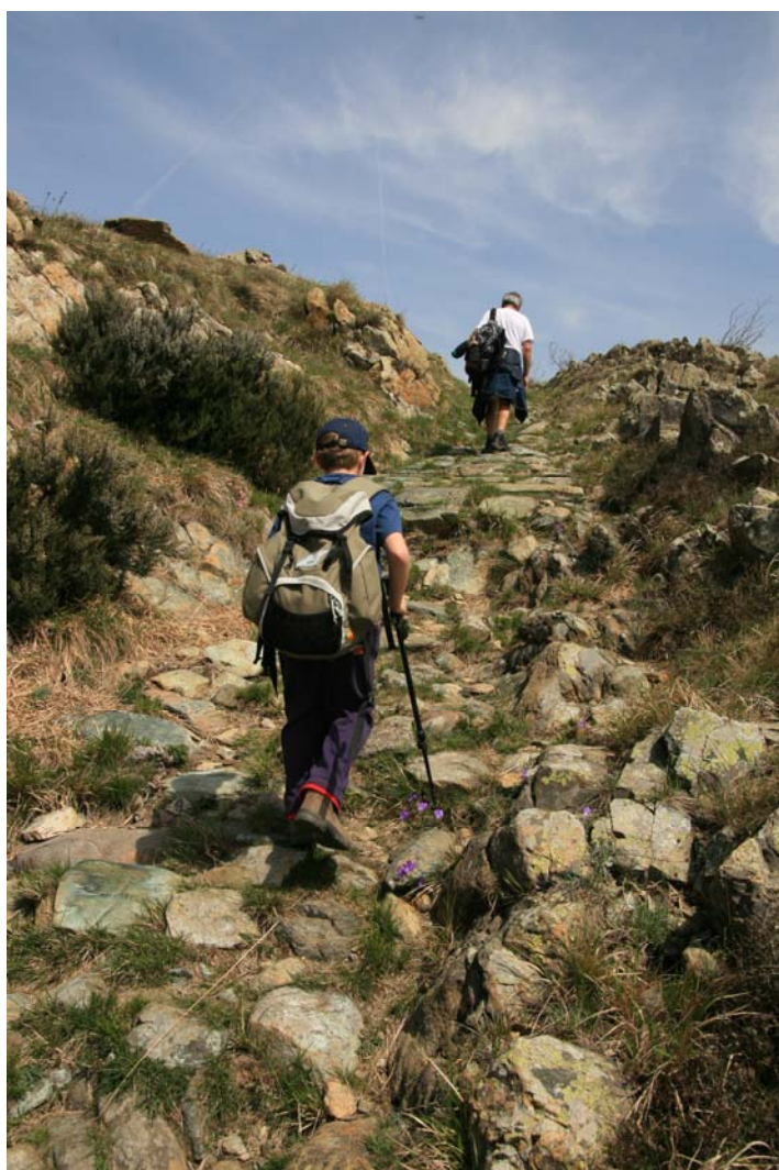
Sul sentiero due punti rossi verso il rif. Gilwell