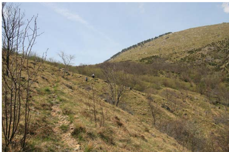
Poco sotto il passo Gava