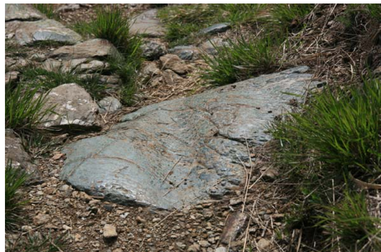
Altra pietra levigata dal passaggio delle slitte