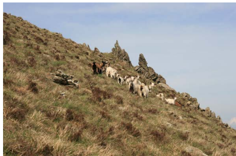
Caprette al pascolo