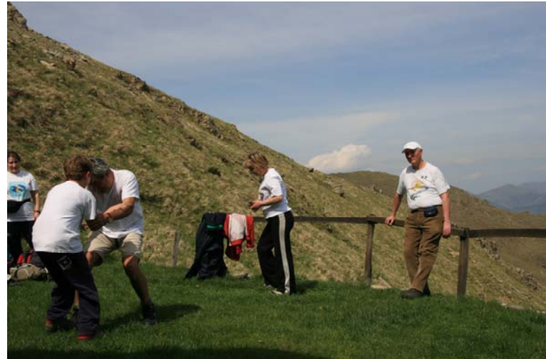
Giochi e riposo presso il rifugio