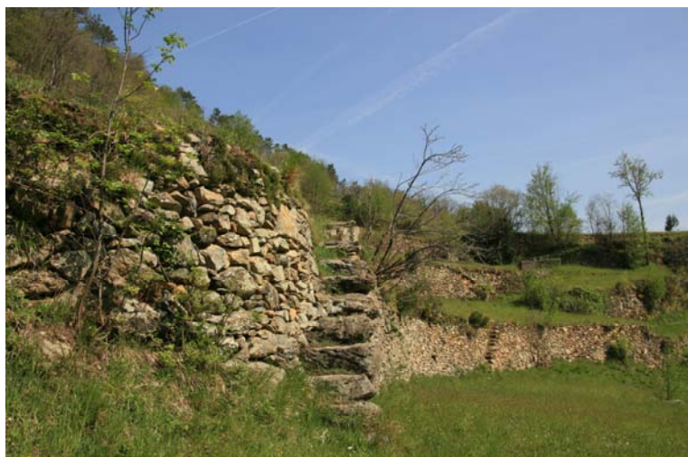
Ancora tanti terrazzamenti perfettamente in ordine