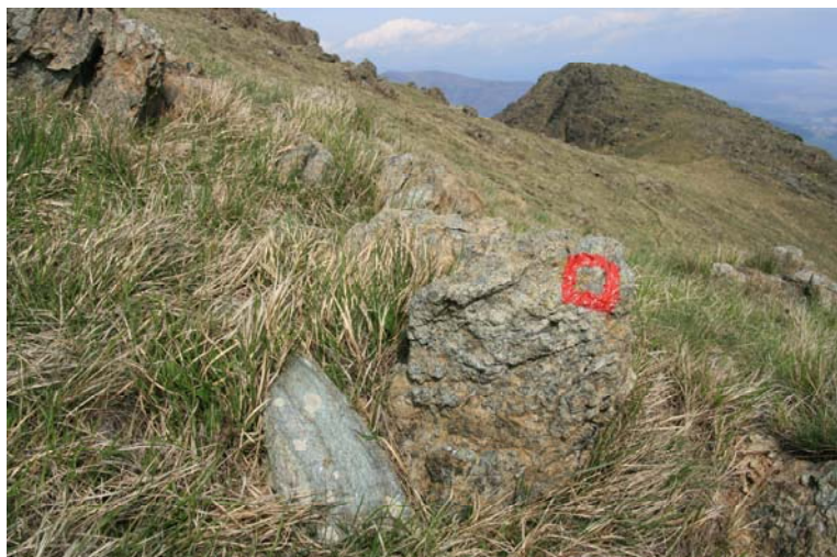
Il segnavia per rientrare a Sambuco