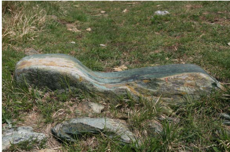
Masso levigato dalle slitte...