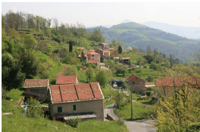
Retrospectiva sul tranquillo villaggio di Sambuco (comune di Genova)