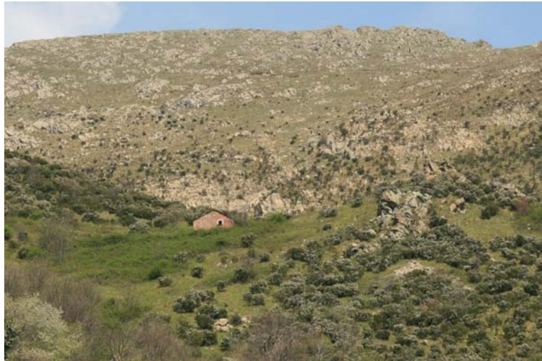
Casa Ravezze o Tilla