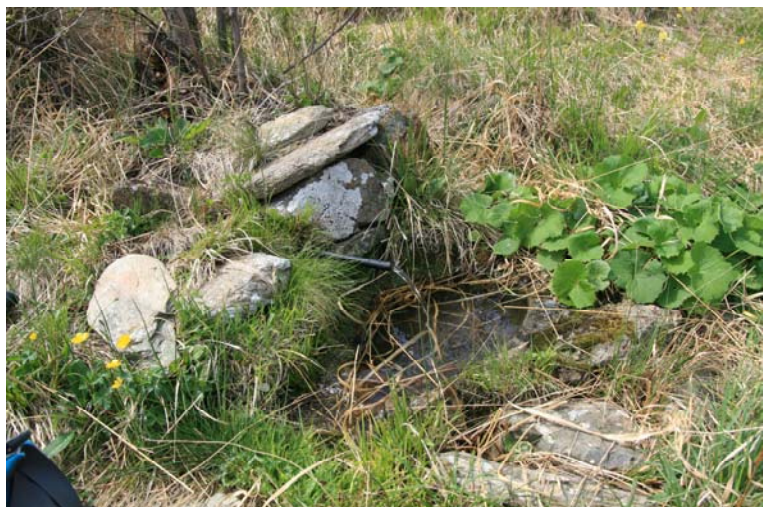
Fonte Piscipaola, poco sotto il passo