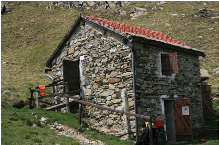
Il rifugio Gilwell 890 mt