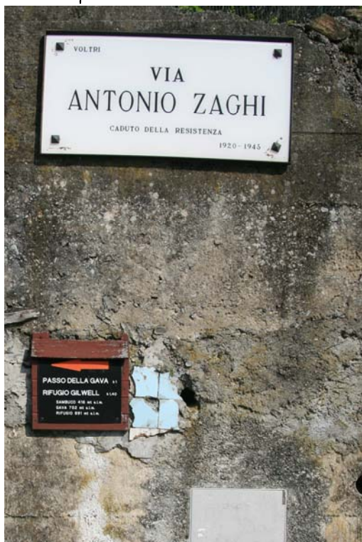
Inizio percorso, dalla piazzetta della chiesa - 400 mt.