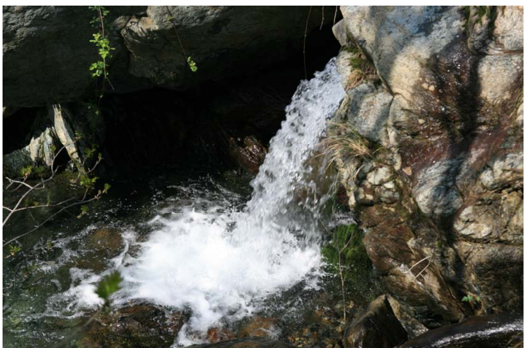
Salto d'acqua del rio Malanotte