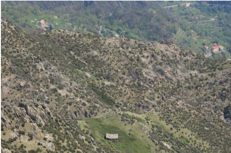
Casa Ravezze o Tilla vista dall'alto, poco prima del bivio per il rifugio