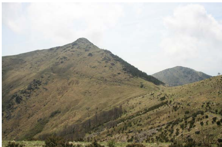
Passo della Gava 752 mt