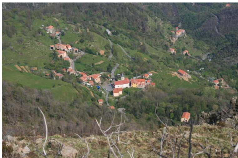
Sambuco visto dall'alto