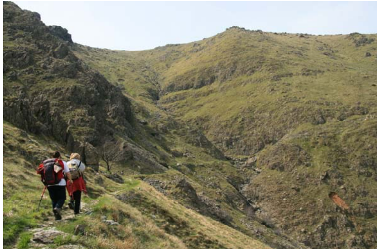
Salendo con i due tondi rossi verso il bivio segnalato (quadrato) per Sambuco