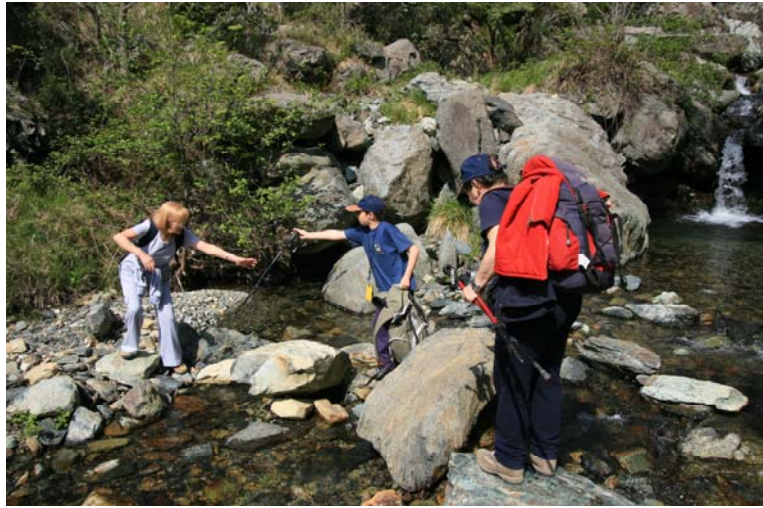
Guardando il rio Malanotte