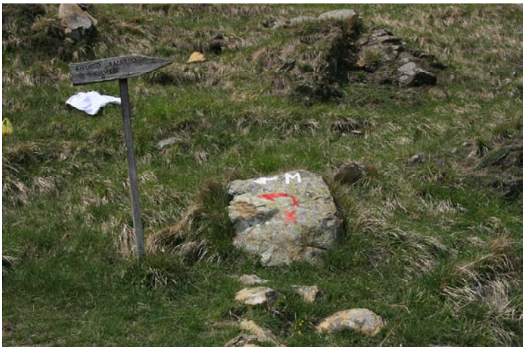
Bivio dalla X rossa presso la fonte a 945 mt