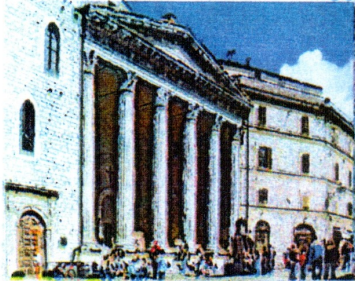
tempio di Minerva

Dopo la pausa pranzo trascorsa in un caratteristico ristorante della città del "SANTO", in modo del tutto alternativo, grazie alla "codifica "del Rosone centrale della basilica di S. Francesco, si seguirà il linguaggio millenario degli sferici mandala in pietra medioevali per raggiungere tutte le altre mete sacre del posto, con il chiaro intento di ritrovare in esse rapporti e particolari collegati alla Geometria Sacra. Durante la visita pomeridiana oltre alle basiliche più belle dal punto di vista "Vibrazionale" si visiterà il tempio di Minerva e il relativo Museo, oltre alla Rocca Maggiore unendo alla storia del Santo quella del dominio Romano