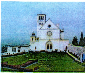
Basilica di S. Francesco

Partenza ore 7.30 da largo Preneste, angolo via Portonaccio arrivo ore 10 presso piazzale Basilica di S. Francesco di Assisi. La nostra gita partirà dalla basilica di S. Francesco con la voglia alternativa di ritrovare, nascosti in molti particolari costruttivi, i collegamenti storici esistenti fra Federico II, il ghibellino costruttore Padre Elia, grande estimatore dell'imperatore Caput Mundi e S. Francesco.