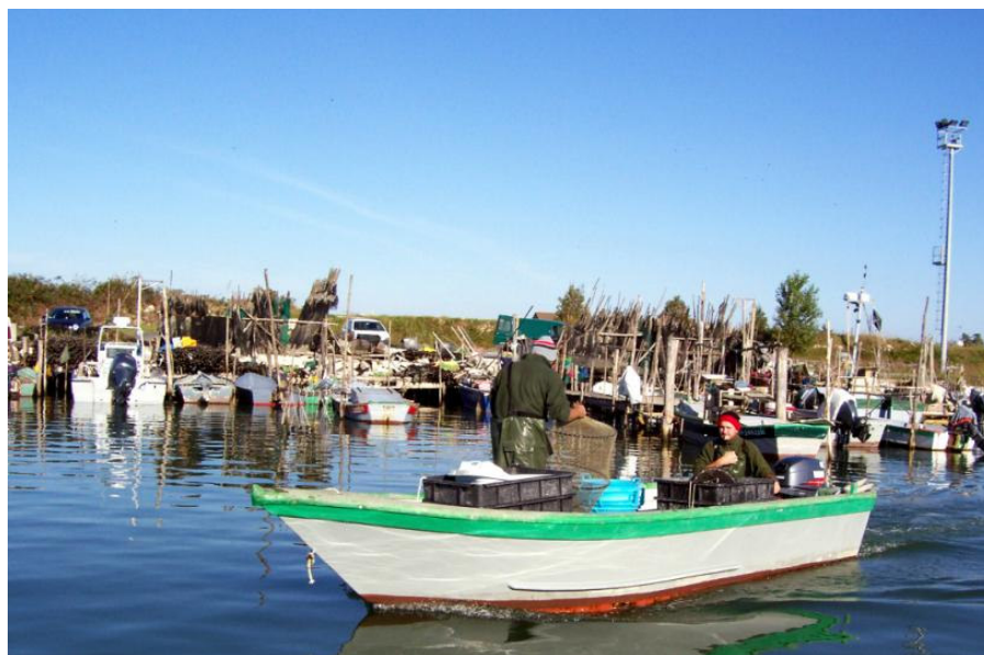
Porto peschereccio Gorino Ferrarese

Lasciato alle spalle il ponte in barche, si entra in un ambiente dove cielo, acqua e terra diventano un tutt'uno e si punta dritti verso il faro non prima di aver visitato il caratteristico porto peschereccio di Gorino Ferrarese.