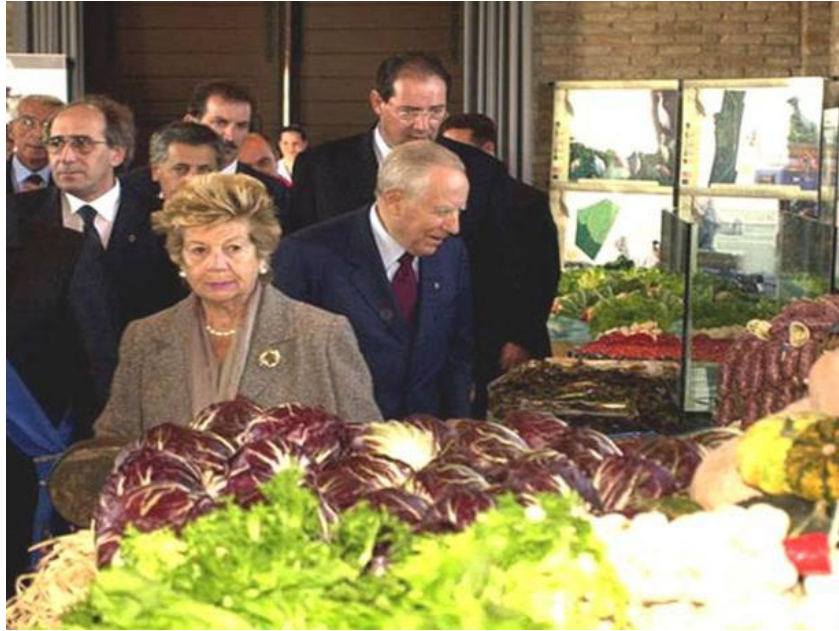
Il Museo della Bonifica nel 2002 ha avuto un visitatore d'eccezione, il Presidente della Repubblica Carlo Azeglio Ciampi e la signora Franca