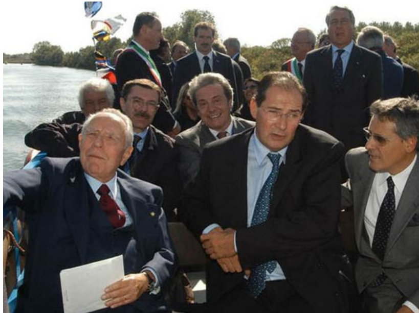
Il Presidente Ciampi ha anche navigato un tratto del Po di Goro