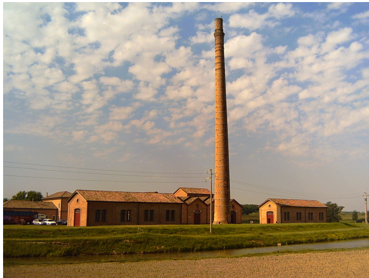
Ca'Vendramin: Museo Regionale della Bonifica

Una visita al castello è d'obbligo e quindi si riparte alla volta di Ca'Vendramin per la visita all'idrovora omonima ora museo regionale della bonifica.