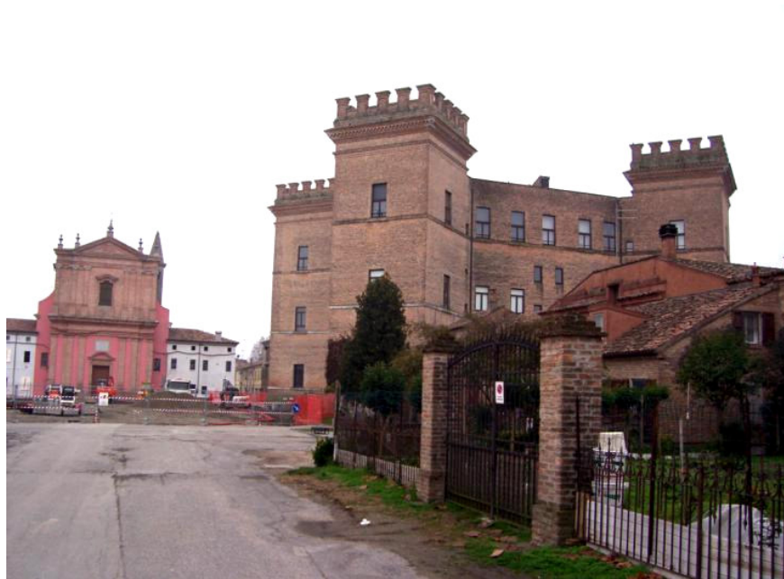
Castello Estense di Mesola

Pasi. Sono gli ultimi anni di splendore del ducato ferrarese. Piuttosto che baluardo per la difesa dei traffici fluviali al confine con la Repubblica di Venezia, è più suggestivo pensare al Castello come l'ultima Delizia voluta dal duca in onore della sua sposa Margherita Gonzaga.