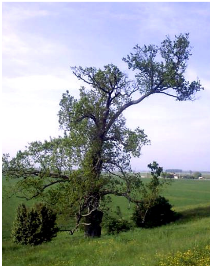
Quercia di San Basilio

Andando a sinistra lungo l'argine si può ammirare la quercia di San Basilio, l'albero più vecchio della provincia di Rovigo, circa 500 anni.