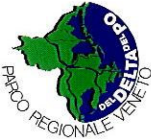
Sede: via Marconi 6

Proseguendo il viaggio si arriva ad Ariano Polesine, proprio davanti la piazza municipale, qui ha sede il parco regionale veneto del Delta del Po.