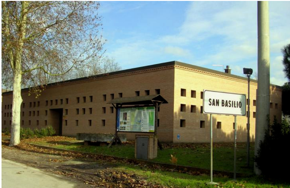
Museo e centro visitatori

Andando a sinistra lungo l'argine si può ammirare la quercia di San Basilio, l'albero più vecchio della provincia di Rovigo, circa 500 anni.