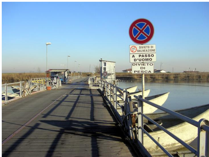
Ponte in barche

Lasciato il museo si raggiunge il suggestivo ponte in barche che unisce Gorino Veneto con Gorino Ferrarese, la provincia di Rovigo con quella di Ferrara. L'operatore addetto al ponte, chiude il traffico stradale e lo apre al centro per far passare il natante.