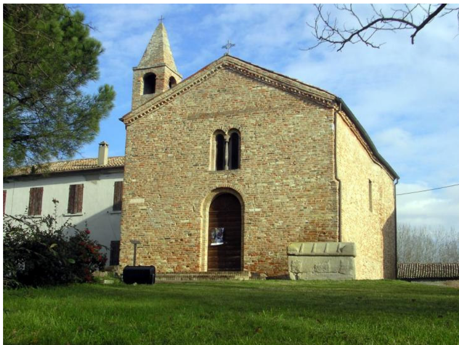
Chiesa San Basilio

Il viaggio continua ed è obbligatoria una sosta a San Basilio con scavi archeologici di notevole importanza. Un viale alberato ci porta al museo di San Basilio e alla chiesetta. La prima e originaria Chiesa di San Basilio fu eretta su una duna sabbiosa, relitto del litorale di epoca protostorica, tra il VI e il X secolo. Un sarcofago in pietra del V secolo racchiude alcuni reperti ossei ed è collocato all'esterno della Chiesa.