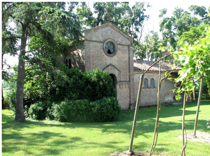
Oratorio corte Milana

Qualsiasi riproduzione e/o duplicazione, anche parziale del presente testo e delle foto, è autorizzata citandone la fonte (il sito web), l'autore (Nicola Berti) e l'anno (2011).