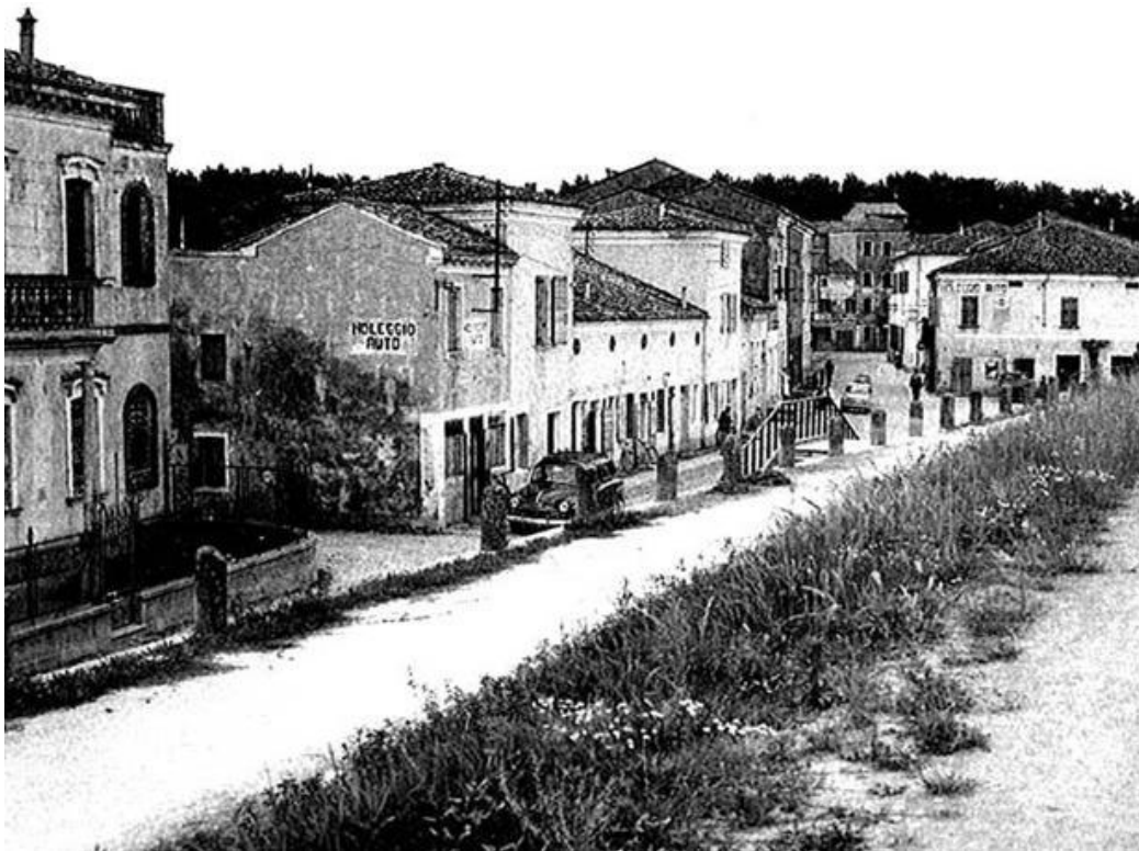
Papozze: Piazza Cantone interamente in golenia sino agli anni sessanta

Appena aprii gli occhi, quando mia madre mi partorì in fretta, era il giugno del '46, vidi dalla finestra di casa la grande distesa d'acqua e subito mi diventò familiare. Dopo tre giorni che ero al mondo mi lasciò in custodia ai nonni. Il grano non aspettava nei campi. Iniziava la mietitura. Era l'unico modo di avere un po' di pane e di polenta per l'inverno. Mio padre era disoccupato, anzi no, in giugno e luglio lavorava nei campi come tagliatore di angurie.