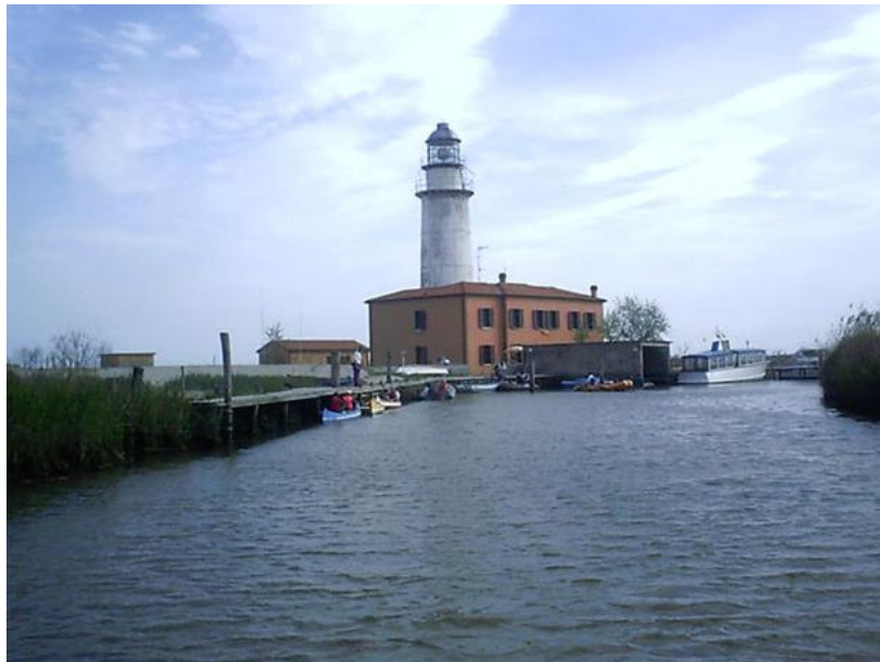
Faro del Bacucco

Io sono nato a quaranta chilometri più a ovest., a Papozze, in una golena che il Po forma prima di dividersi in Po di Goro e Po di Venezia. Lì inizia il Delta.