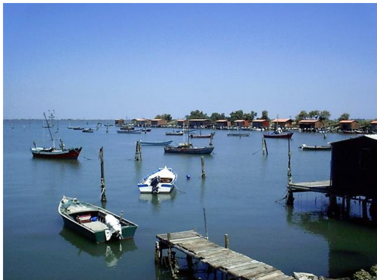
Sacca di Scardovari