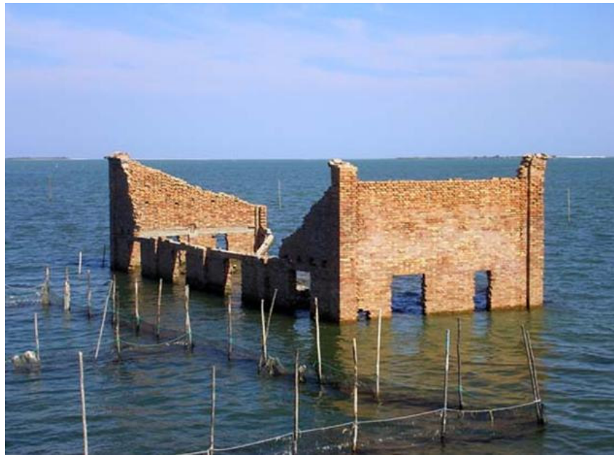
Sacca di Scardovari: vecchio magazzino del riso