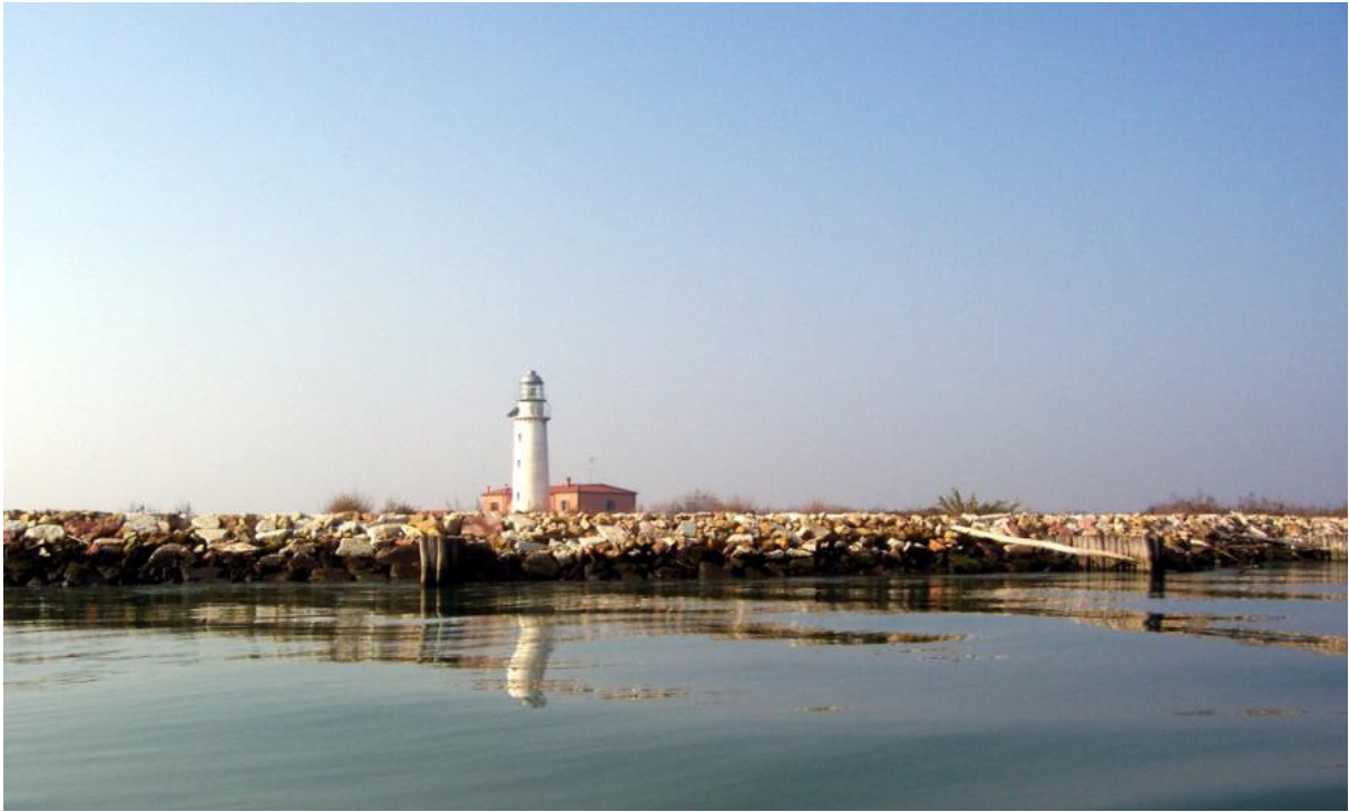
Il Po di Goro si getta nell'Adriatico