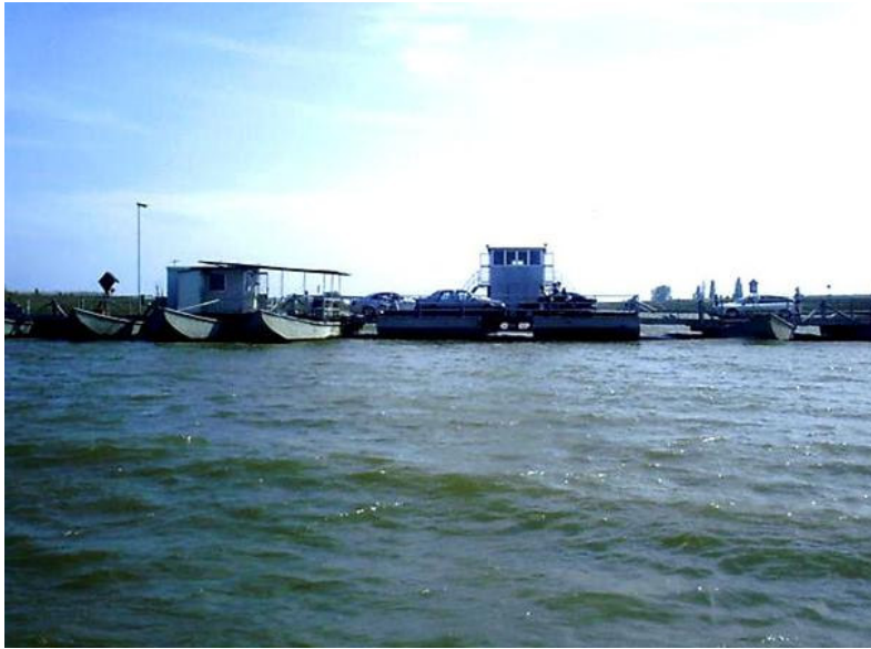
Ponte in Barche sul Po di Goro

Primo agosto 1978. Sono le quindici circa. Un sole alto e caldo brucia la pianura e riscalda con i suoi raggi le acque opache del Grande Fiume che, prima di gettarsi in mare, al Bacucco, accarezzano le barche di cemento dell'ultimo ponte a Gorino Sullam. Il cartello quadrato a fondo bianco segna in mezzo al ponte: km. 652.