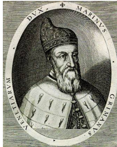
Doge Marino Grimani

Inizialmente il Papa, a corto di denaro, aveva chiesto a Venezia di finanziare il progetto del taglio sopra Papozze, con l'immissione delle acque padane nel Po di Ariano, impiegando i fondi disposti per effettuare il taglio a Porto Viro. Tale proposta era però stata decisamente respinta dalla Repubblica Veneta perchè, in definitiva, risultava favorevole solo alla Santa Sede che con il taglio Papozze Santa Maria del Traghetto avrebbe rinvigorito il contrabbando a danno dell'erario veneziano. Il progetto Pontificio, inoltre, non offriva alcuna garanzia alla soluzione del problema bassopolesano e lagunare. Concluse le trattative con il Pontefice, il Senato Veneto approvò il 27 agosto 1599 le disposizioni e scritture presentate il 12 luglio 1599 dai 12 delegati e dai periti per il taglio a Porto Viro.