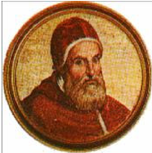
Papa Clemente VIII