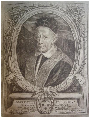
Papa Innocenzo XII

Anche i Pontefici, come in precedenza la casa d'Este, concessero e confermarono i privilegi alla villa di Papozze.