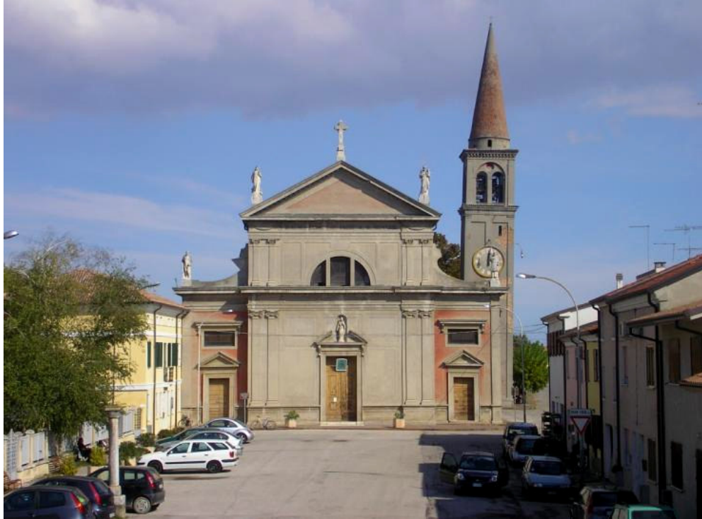
La chiesa parrocchiale