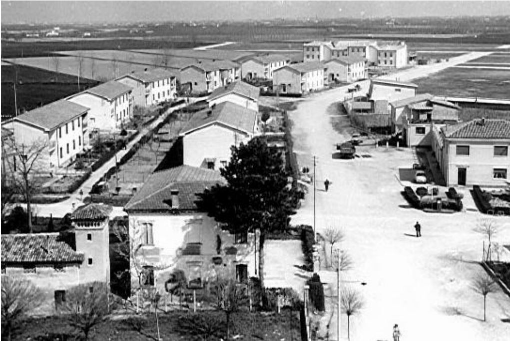
Villaggio San Carlo