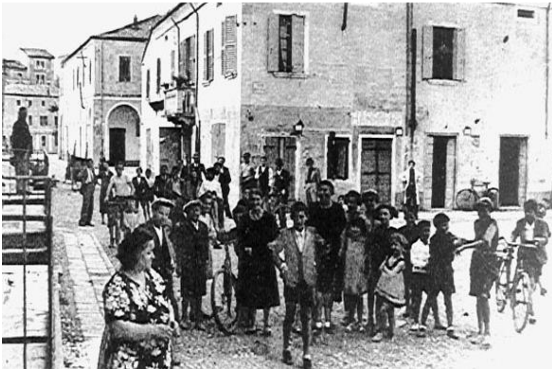
Una giornata a Papozze negli anni cinquanta

La vita correva lenta e laboriosa, Papozze nel 1939 aveva raggiunto 5.555 abitanti, un paese di agricoltori, piccoli commercianti, artigiani, pescatori e "barcai". Intensa anche l'attività culturale e quella ricreativa: spettacoli di prosa e grandi serate danzanti nel teatro, bellissime manifestazioni fieristiche: Madonna della Neve (località Borgo), San Bartolomeo Apostolo (patrono di Papozze), San Carlo Borromeo (compatrono), Redentore (località Caderuschi), San Luigi Gonzaga (Panarella).