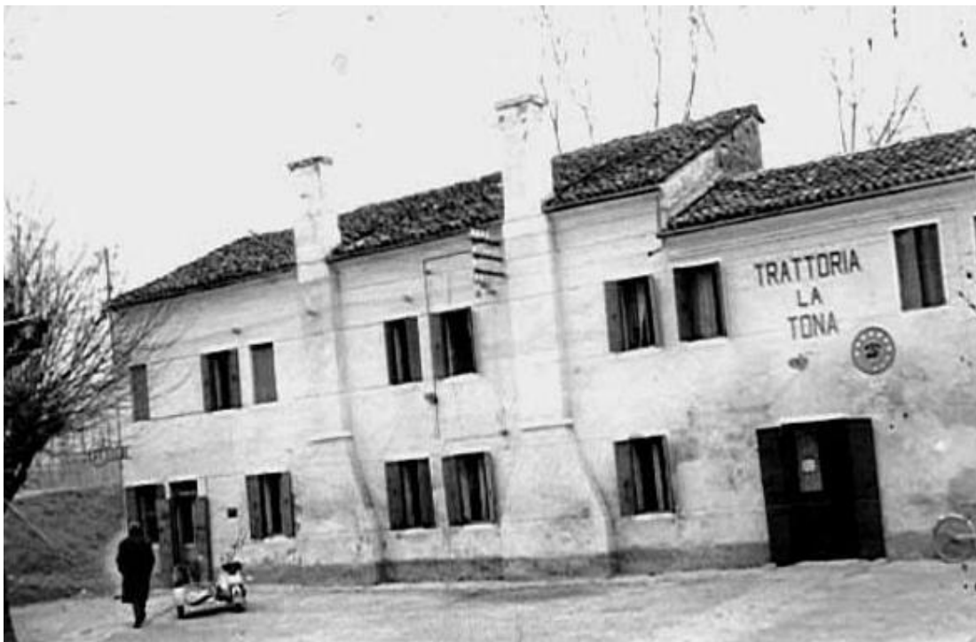
Trattoria "La Tona"