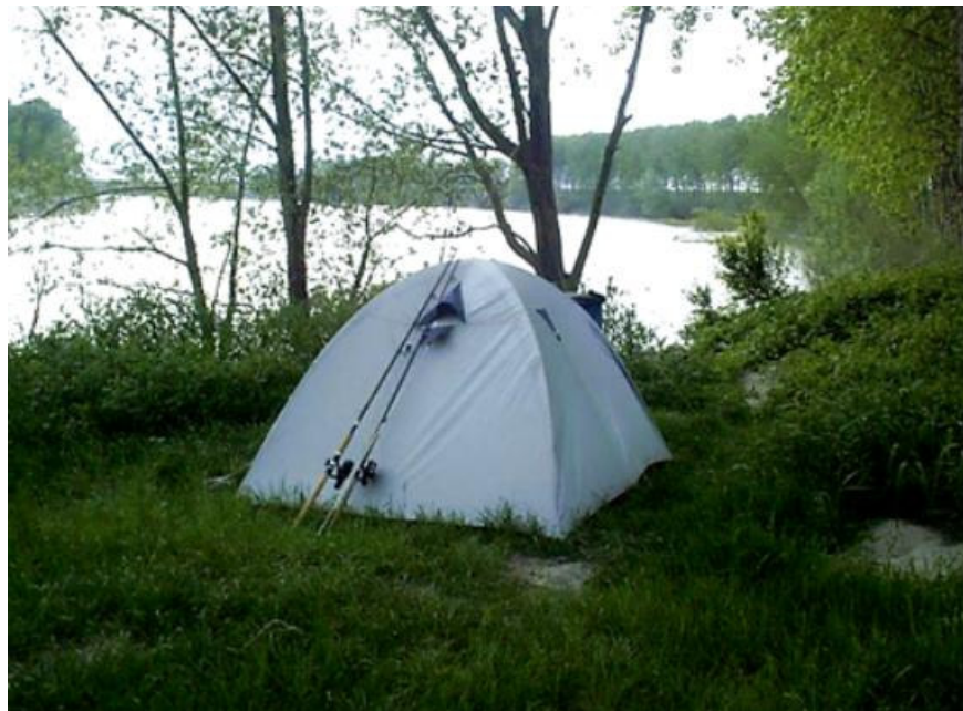
Tenda ungherese lungo il Po di Goro

E il Delta del Po sta ottenendo una spinta promozionale davvero inattesa e insperata. Le settimane di pesca al siluro fanno richiamo, soprattutto nei mesi da marzo a giugno e in settembre. Insomma, le settimane in riva al Po piacciono, come mix tra avventura e natura. E il Delta ringrazia.