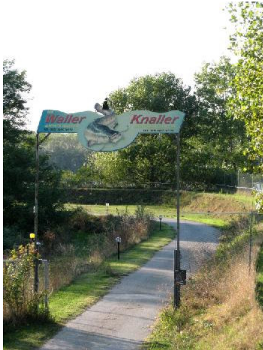
Porto Viro: Centro turistico nautico Po di Venezia tel. 0426-322580