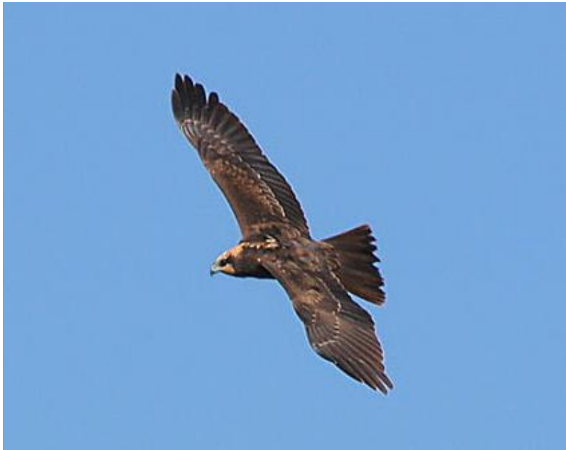
Falco di palude

Ambienti particolarmente ricchi di specie per l'ampia varietà di situazioni che presentano sono i canali le golene fluviali e i bonelli (vaste isole di foce coperte di Cannuccia palustre) più prossimi alla foce. Tra i canneti nidificano l'airone rosso e il falco di palude; vi si rifugiano e nutrono anche passeriformi come il Basettino, il Cannareccione, il Migliarino di palude e l'Usignolo di fiume. Nelle valli d'acqua dolce del Delta Emiliano nidificano il Mignattino e il rarissimo Mignattino piombato i quali costruiscono il loro nido sulle ninfee. Nelle valli e lagune nidificano il Fraticello, la Sterna comune, la Sterna zampenere, ma anche il Beccapesci, il Gabbiano comune, il Gabbiano reale, la Pettegola, il Cavaliere d'Italia, l'Avocetta. Sono presenti anche l'Airone rosso, la Spatola e la Volpoca.