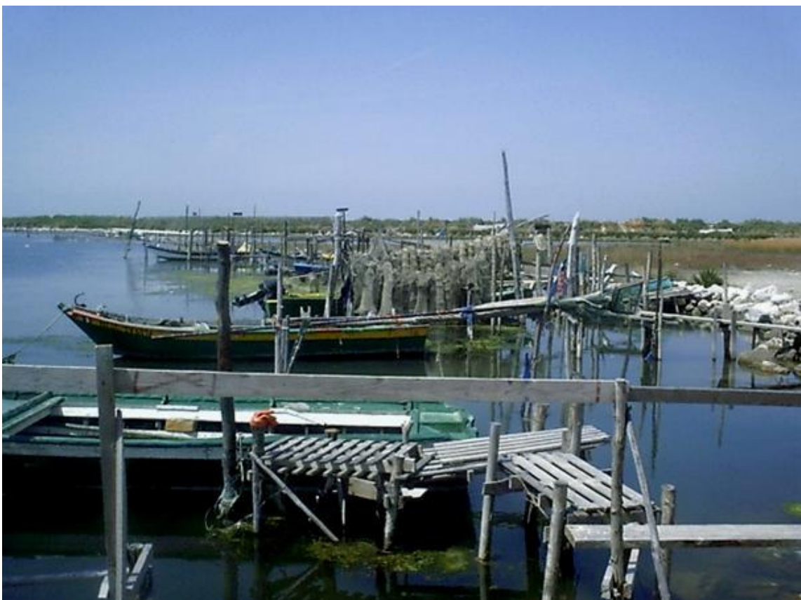
Sacca di Scardovari

Velme: banchi di limo che emergono quando il fiume è in magra