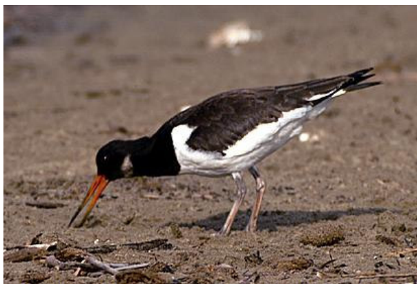
Beccaccia di mare

Di estremo interesse sono pure gli scanni, gli stretti litorali che separano le lagune dal mare. Vi nidificano la Beccaccia di Mare (rara in Italia ma con oltre 100 coppie stimate nel Delta), la Volpoca, L'Avocetta, il Fratino e il Fraticello.