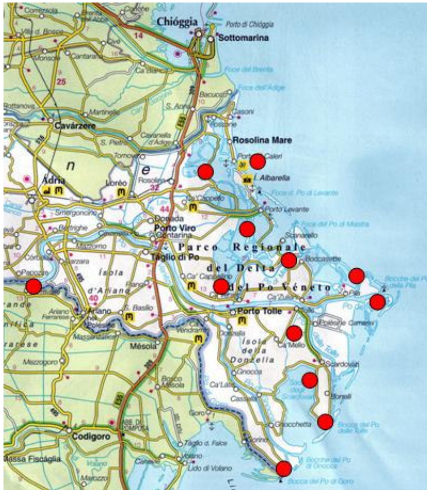
Principali luoghi di osservazione