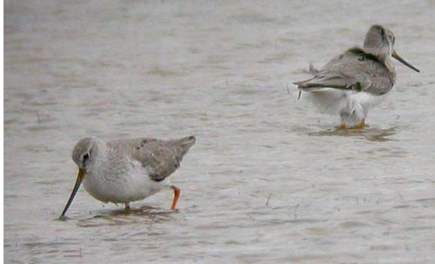
Piro Piro del Terek

Il grande aeroporto del Delta del Po è sempre aperto anche a piacevoli sorprese. Nella primavera del 2005 sono atterrati per la prima volta a Boccasette di Porto Tolle il Piro-piro Terek e il Corriere di Leschenault, mentre nell' estate appena trascorsa presso la Sacca di Scardovari è stato avvistato per la prima volta il Falaropo beccolargo limicolo nidificante nella lontana Islanda.