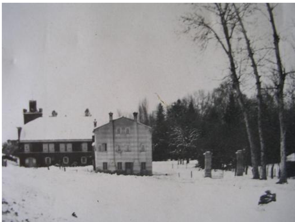
Villa Camerini poco prima di essere demolita