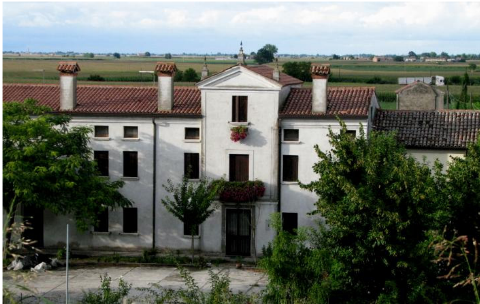
Palazzo De Sante in località Santi (tra Villanova e Papozze)

(64) Natività di Maria Bambina. Festa dell'8 settembre in località Santi 42 1880-1945