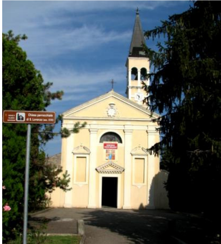
Chiesa parrocchiale di Canalnovo dedicata a San Lorenzo