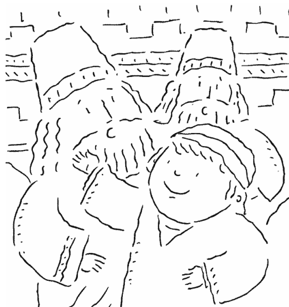
Bambini, questo disegno è da colorare!