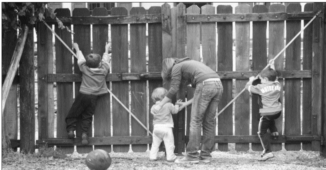
Dai campi estivi

Come adulti siamo responsabili non solo di come facciamo funzionare il mondo ma anche di come lo presentiamo ai nostri ragazzi