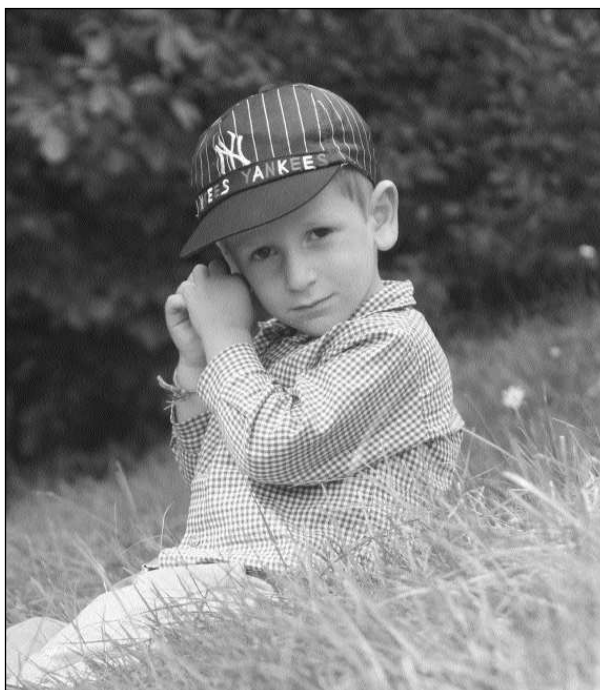
Dai campi estivi

Ma ai figli servono delle mamme non proprio