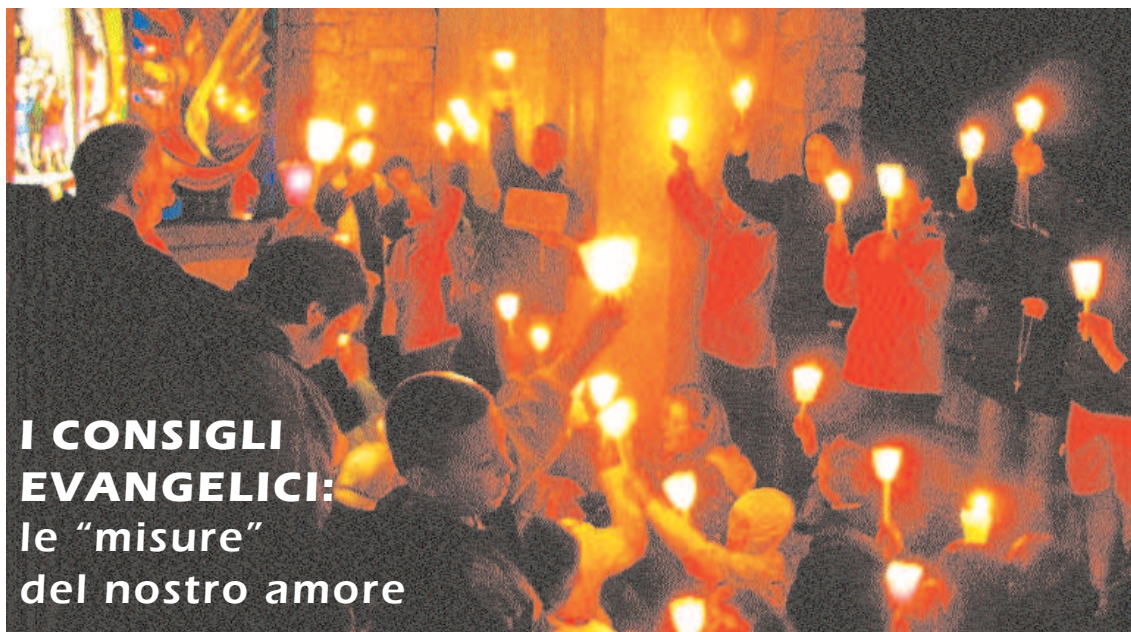
Dai campi estivi 2008