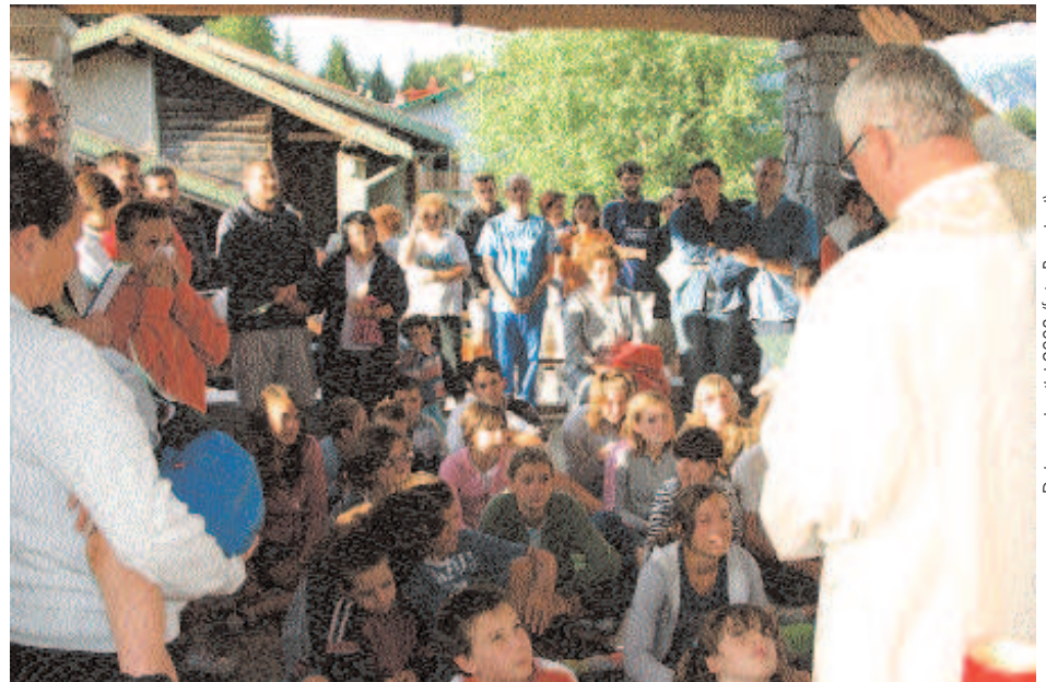
Dai campi estivi 2008