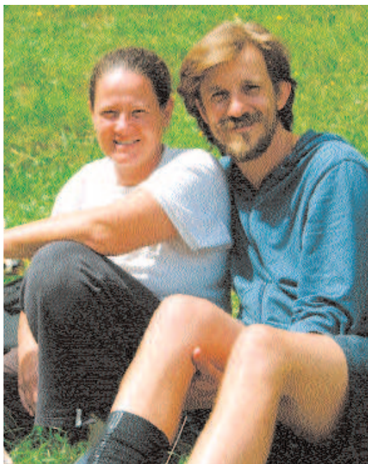
Da campi estivi 2008

* coppia responsabile del Collegamento tra GF