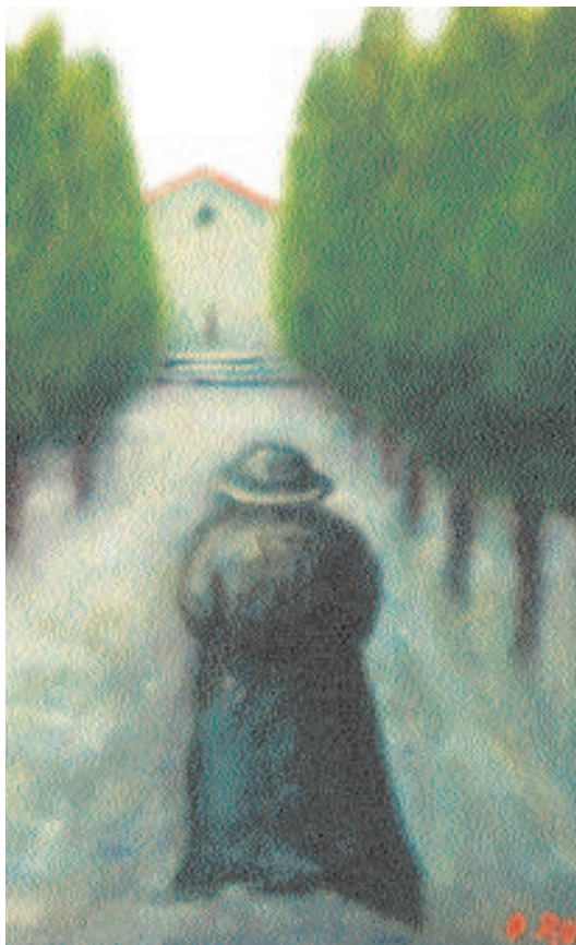
Dalla copertina del libro di E. Bianchi: Ai presbiteri (Olio di Ottone Rosai)

Penso alla fatica di far crescere la comunità non attorno a "criteri umani" ma nella sequela di Cristo e dei valori che Egli ha vissuto e testimoniato. E non mi scoraggia esser definito un "illuso", fuori del tempo, contrario al buon