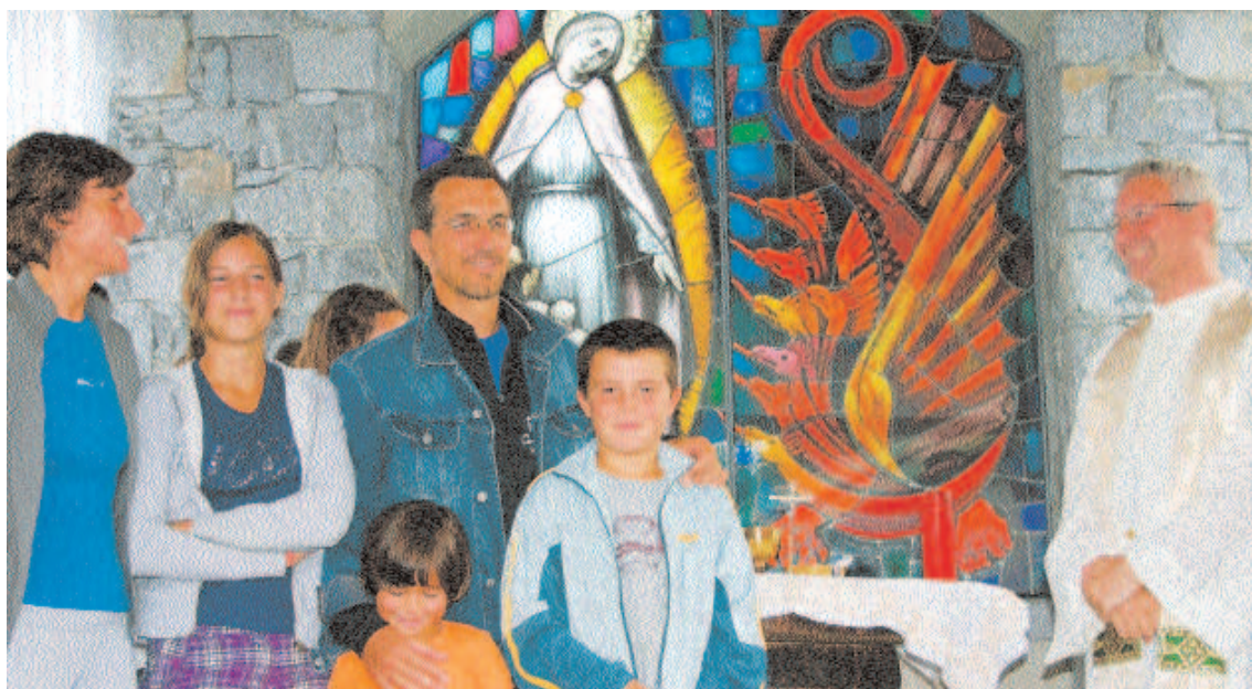
Da campi estivi 2008

L'importanza del sacerdote per la nascita e la crescita dei GF parrocchiali