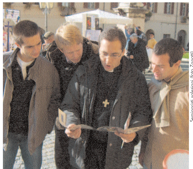
Seminaristi salesiani