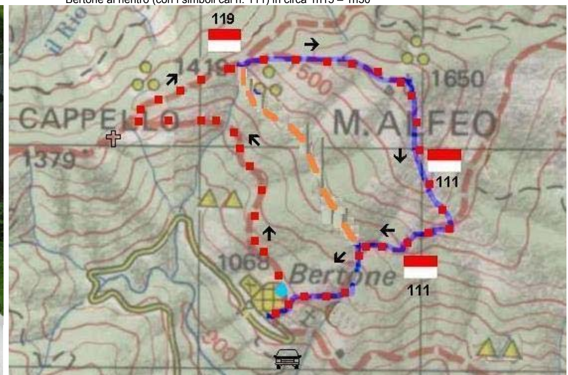
Foto cartina del percorso... in totale quasi 600 m di dislivello, una percorrenza totale di circa 3h15 – 3h45