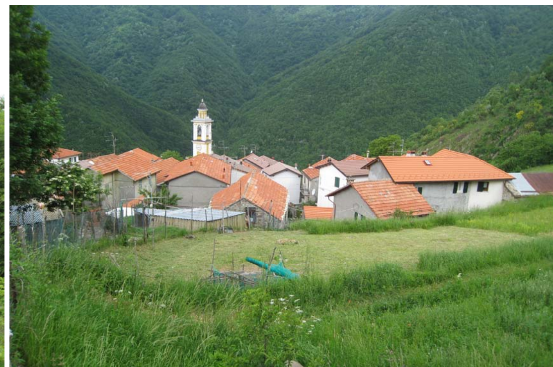
Bertone al rientro (con i simboli cai n. 111) in circa 1h15 – 1h30