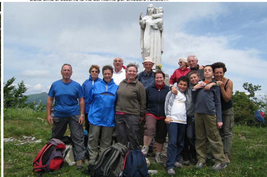
Foto di parte del gruppo dalla vetta