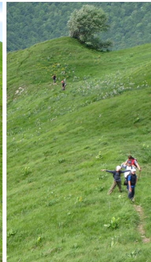
Una delle ultime rampe da conquistare....