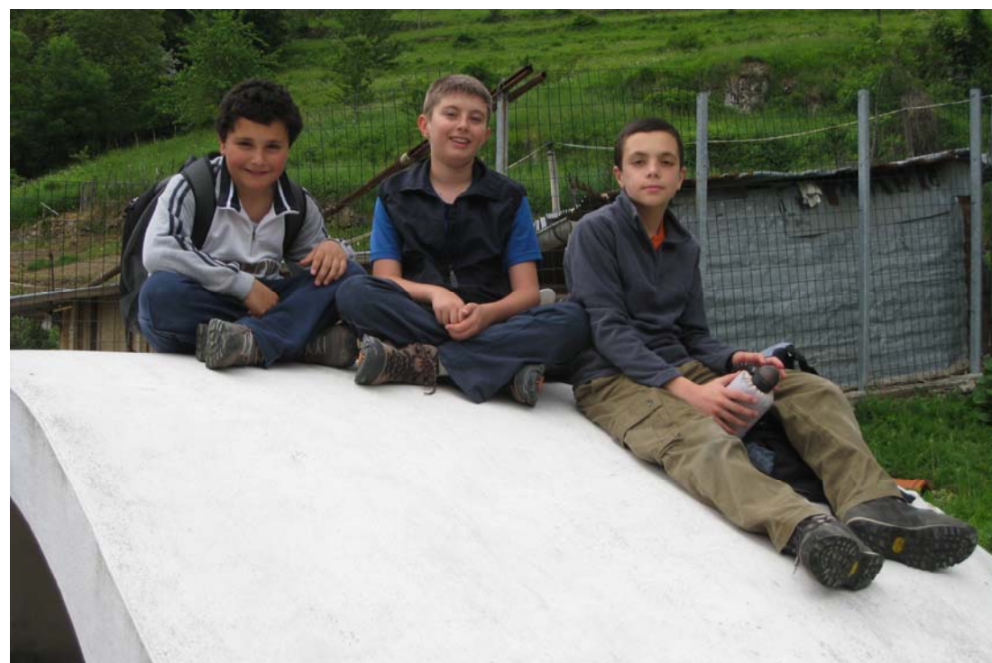
Sopra la fonte a Bertone