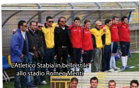
L'Atletico Stabia in bello stile allo stadio Romeo Menti

Bravi ragazzi, Buona fortuna Atletico Stabia!!!