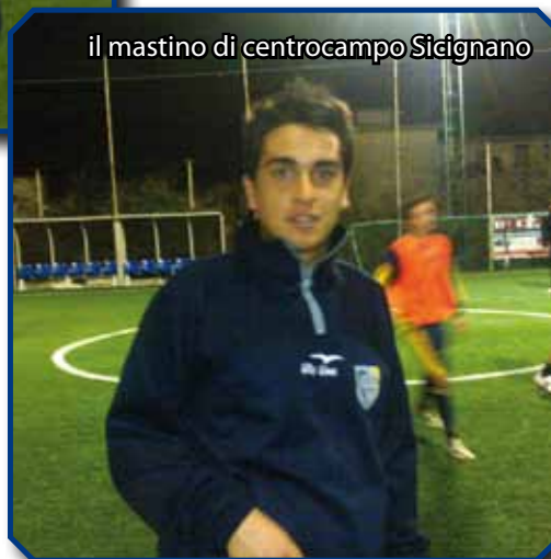
il mastino di centrocampio Sidignano