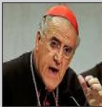
Il Cardinale Barragán

Egli, definendo la bioetica "...lo studio sistematico e profondo della condotta umana nel campo delle scienze della vita e della salute, alla luce dei valori e dei principi morali", conduce il discorso nel campo più ampio di un nuovo progetto di etica universale e globale che oggi, sempre più spesso,